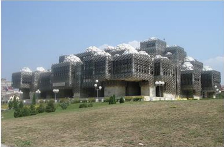
Figura 2.2. Biblioteka Kombëtare dhe Universitare e Kosovës e themeluar në nëntor të vitit 1944 me seli në Prizren, është bartur në Prishtinë më 1946. Veprimtarinë e vet në objektin arkitektonik të stilit të veçantë me kupola, në të cilin edhe tash vepron, e fillon në vitin 1982. (Kjo figurë është prezantuar në kolor, printimi bardh dhe zi mund të mos e pasqyrojë qartë përmbajtjen e saj)